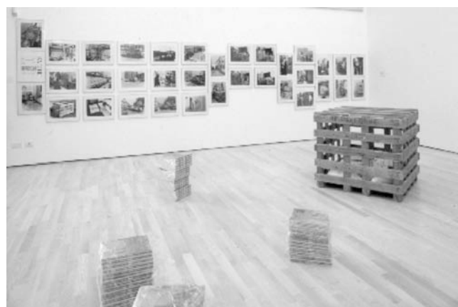
Joseph Beuys – Grassello 1979-80 - cassa in legno, sacchi di calce e libri, cm 92 x 102 x 110 Mart, Rovereto

Analoga motivazione è alla base dell'interramento e della conservazione dei sacchi di Grassello, che Beuys chiude nella botola della sua abitazione studio. L'ultima e significativa immagine riprende solo i piedi posti davanti i sacchi, dunque solo la parte terminale